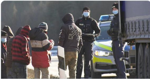
Idstein: Fahrer festgenommen: 11 Flüchtlinge auf Lastwagen entdeckt Bei zwei Lastwagen-Kontrollen in Hessen hat die Polizei elf Flüchtlinge aus Afghanistan entdeckt. bild.de

Das sind keine Flüchtlinge - das sind illegale Einwanderer, Straftäter. Während unsere Soldaten in Afghanistan ihr Leben riskieren - haben wir eine ganze Armee von Männern im wehrfähigen Alter hier Abgeschoben wird sowieso keiner! Das ist eine Invasion!