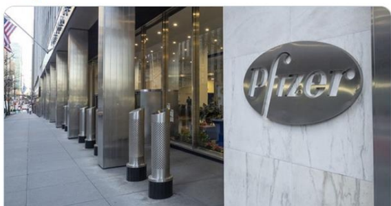
Lateinamerika: Pfizer fordert in Geheimklauseln Aufhebung nationaler Gesetze Geheimklauseln des US-Pharmakonzerns Pfizer rufen in Argentinien und Uruguay Empörung hervor. Die Länder müssen auf jegliche Schadensersatzforderungen ... de.rt.com

Geheimklauseln des US-Pharmakonzerns #Pfizer rufen in Argentinien und Uruguay Empörung hervor. Die Länder müssen auf jegliche Schadensersatzforderungen verzichten und Zahlungsgarantien in Form von Ölquellen, Fischereirechte und Süßwasserreserven ablegen.